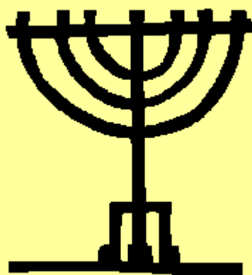
לפי פסיפס, יריחו, המאה ה-6 לספרי'ן