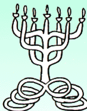
לפי לוח ברכה "שיויתי", פולין המאה ה-19