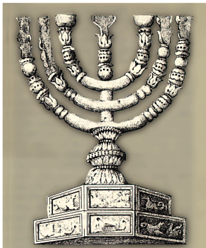
תבליט המנורה שעל שער טיטוס ברומא