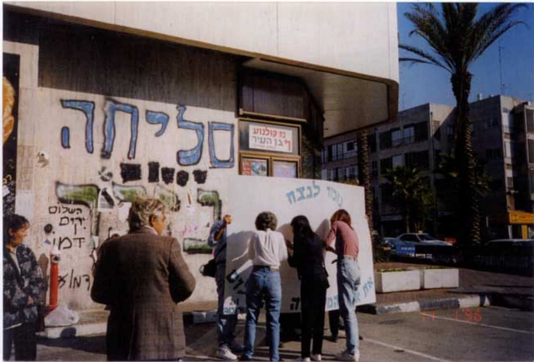
באדיבות רוחה שבא