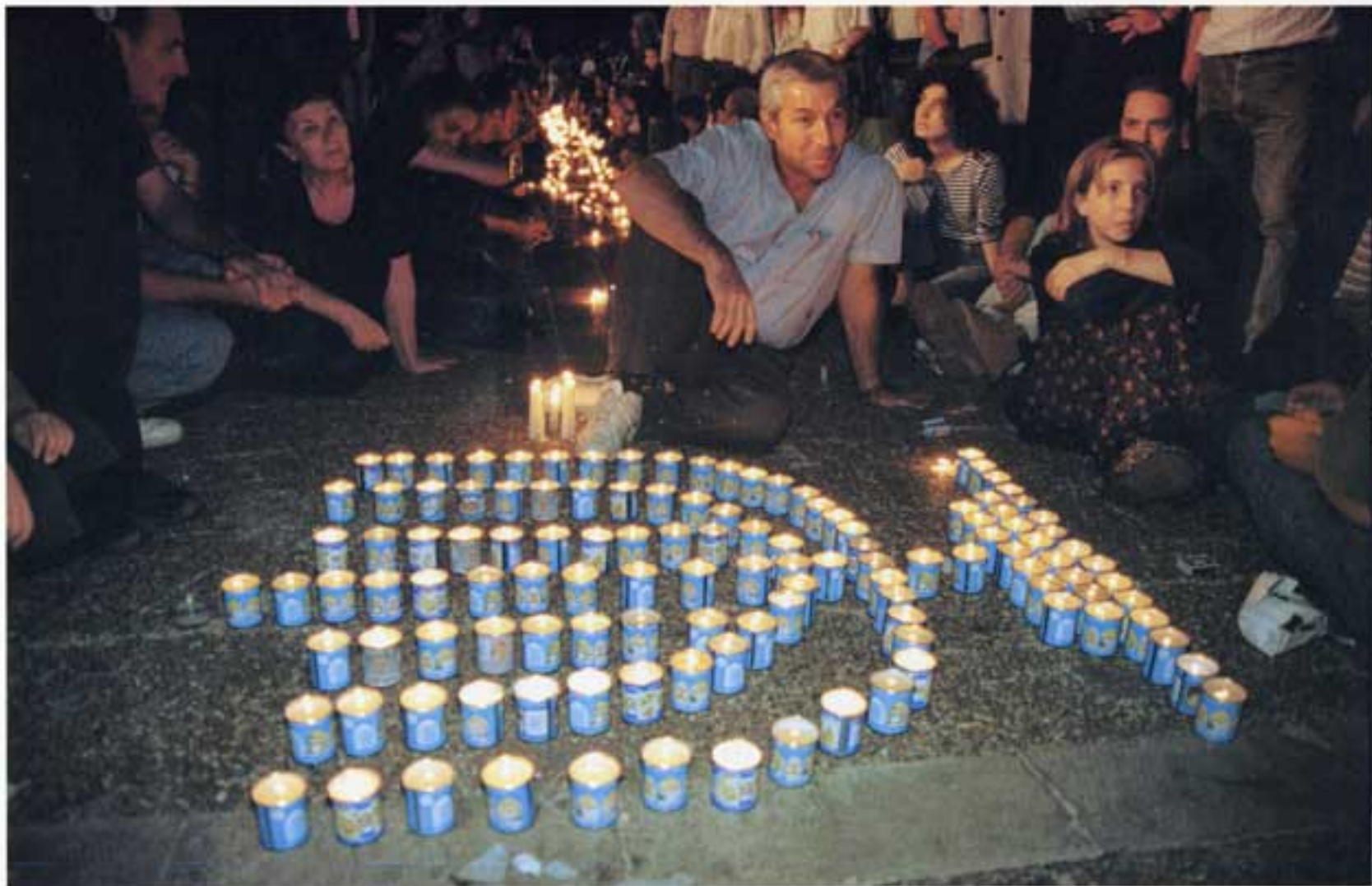
כיכר מלכי ישראל , נובמבר 1995