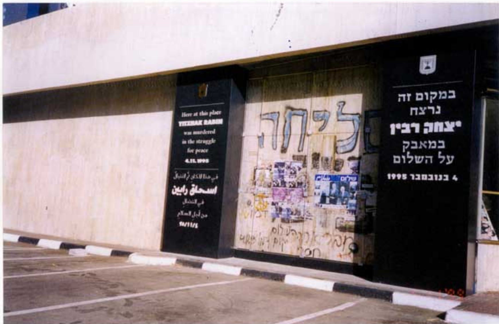
תמונה מס' 8: אותה פינה לקראת יום הזיכרון ה-4 לרצח יצחק רבין. הרחבה ליד מקום הרצח עוצבה, סוידה לבן וחלק מכתובות הקיר נשמרו במסגרת. נובמבר 1999