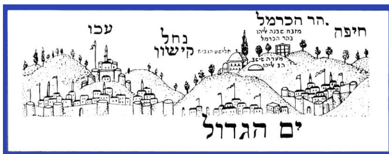
ציור יהודי עממי של אזור חיפה והכרמל