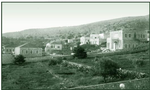
שכונת "הרצליה" היהודית על הכרמל 1907