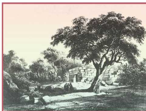
המוחרקה בציר מ-1851