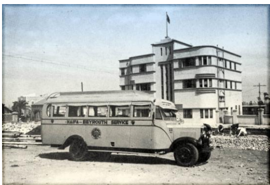
אוטובוס ראשון בקו חיפה-בירות, תקופת המנדט