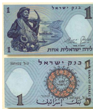
"שטר חיפה" משנות ה- 50